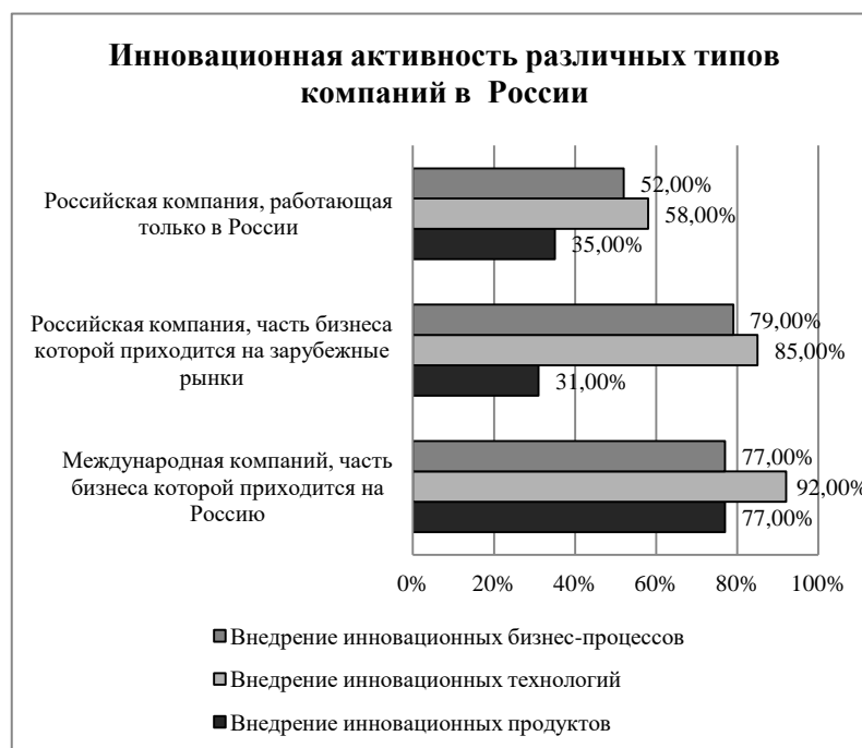
Рисунок 3. 2 – Инновационная активность различных типов компаний в России в 2009 г.