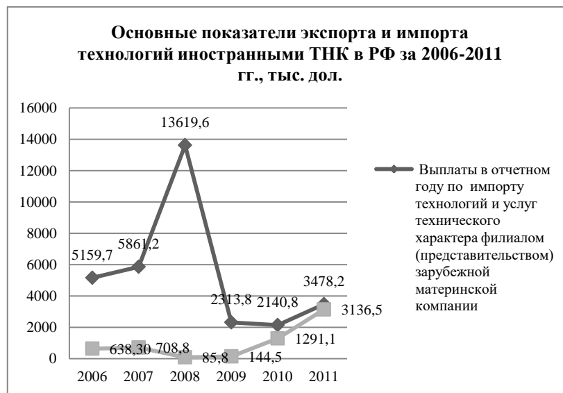
Рисунок 3. 1 – Основные показатели экспорта и импорта технологий иностранными ТНК в РФ за 2006-2011 гг., тыс. дол.